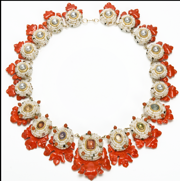
1/9 BodyFurniture - Collana Akanto.