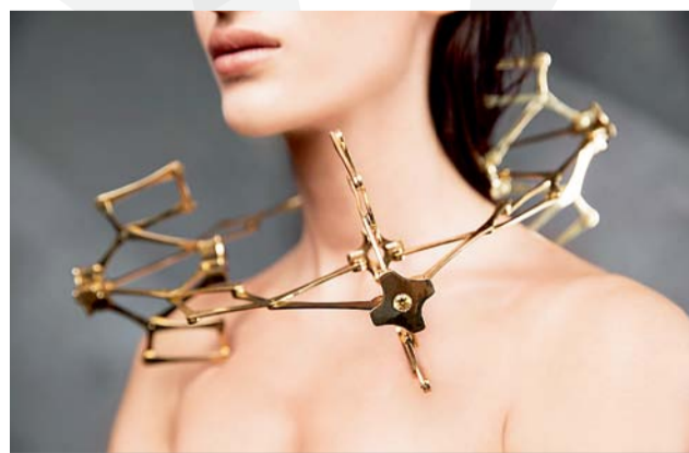
Отбор конкурсных работ на ARTISTAR JEWELS