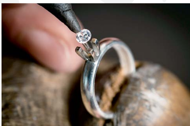
Таиланд вводит аттестацию ювелирных предприятий, торгующих бриллиантами

«Artistar Jewels» начинает отбор конкурсных работ. В следующий раз он пройдет с 19 по 24 февраля 2019 года во время Миланской Недели Моды. Жюри объявит победителей и вручит призы самым достойным. На конкурс будут приглашены представители концептуальных салонов, которые будут выбирать ювелирные творения для представления в своих магазинах.