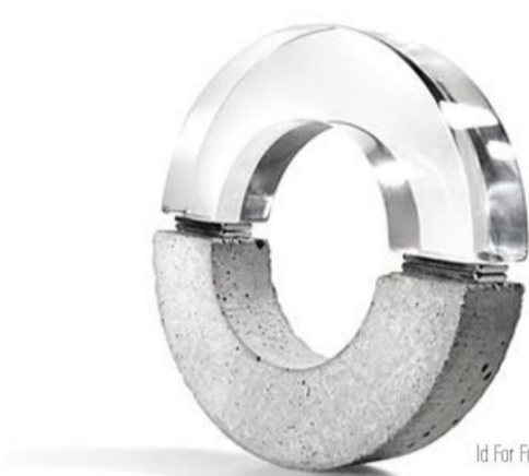
Id For Fun