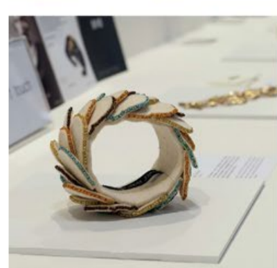
Vaciđe Erda Zircic