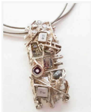
Ожерелье MAGMA. Fior di Lotto, Италия. Серебро и электронные элементы, струна басок

В состав жюри конкурса вошли ведущие искусствоведы и эксперты в области ювелирного искусства и дизайна: