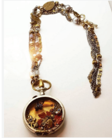
Ожерелье LA STRANA COPPIA. One Off – Emotional Hardware, Италия. Корпус от старых карманных часов, медная цепь, кристаллы, жемчуг, серебряные бусины, медь

Artistar Jewels родился с целью распространения культуры современного украшения, предвидения будущих мировых тенденций. Это единственный конкурс в Италии и один из немногих в мире, который может предложить уникальную панораму на эволюцию современного ювелирного дизайна.