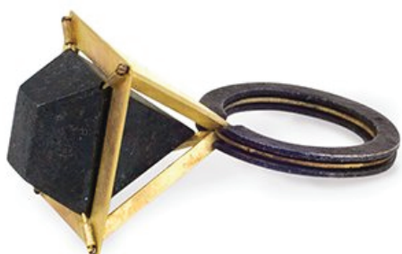
Кольцо SMALL BLACK RING. Philip Sajet Нидерланды

Эта выставка яркий пример того, что ценностью современного ювелирного искусства является не драгоценные материалы, а отражение духа времени; времени, в котором мы живем, работаем, путешествуем. На выставке много неизвестных художников-ювелиров, однако объединяет их всех поиск нового, смелого и креативного воспроизведения действительности.