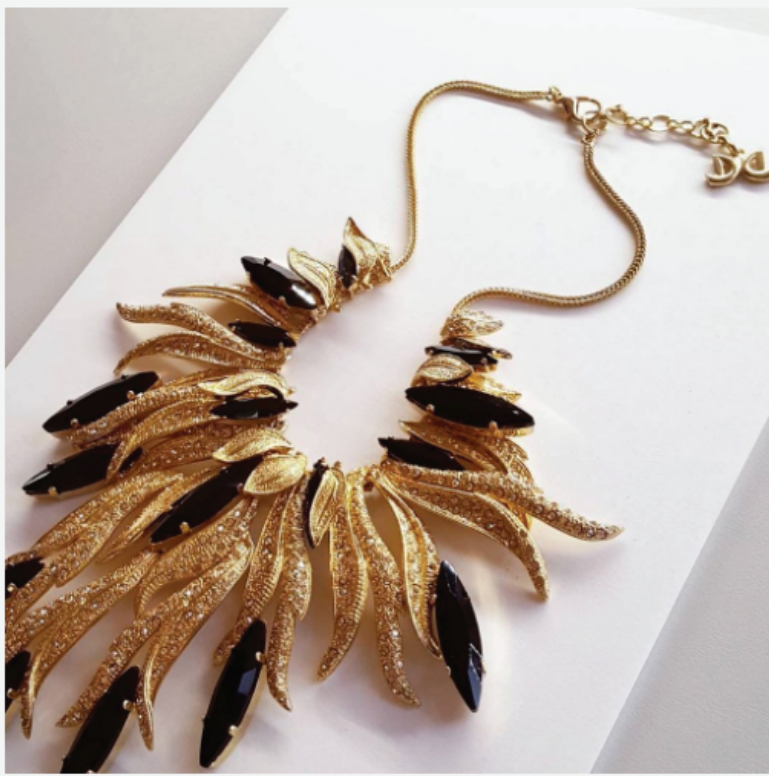
Ожерелье De Liguoro, Италия