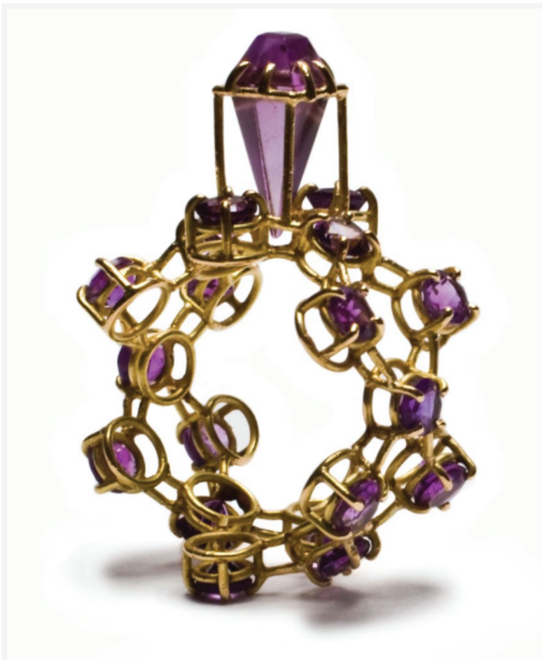
Кольцо AMETHYST. Philip Sajet