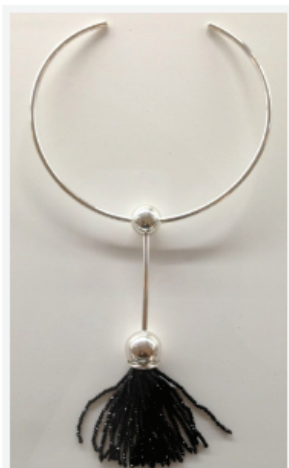
Ожерелье TASSEL-BLACK SPINELL. Sebastian Schildt AB, Швеция. Серебро, Черная шпинель