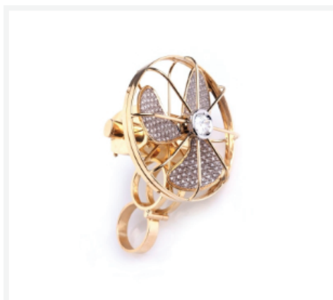
Кольцо FAN RING. furutoRemoto di Gianni de Benedittis, Италия

Победители получат возможность бесплатно участвовать в выставке Artistar Jewels 2018 и появятся в специальной секции каталога выставки 2018. Компания De Liguoro выберет одного из участников для сотрудничества в области дизайна украшений, а молодому автору, не достигшему 27-ого возраста, Амброзианская ювелирная школа предложит обучение по курсу «Ювелирное мастерство» и реализацию дизайнерских проектов школы.