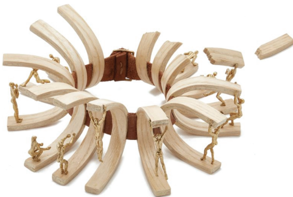
Ожерелье VALUTAZIONE DEL RISCHIO. Artisticalmente di Leonardi Emanuele, Италия. Дерево, бронза, кожа

Победители получат возможность бесплатно участвовать в выставке Artistar Jewels 2018 и появятся в специальной секции каталога выставки 2018. Компания De Liguoro выберет одного из участников для сотрудничества в области дизайна украшений, а молодому автору, не достигшему 27-ого возраста, Амброзианская ювелирная школа предложит обучение по курсу «Ювелирное мастерство» и реализацию дизайнерских проектов школы.