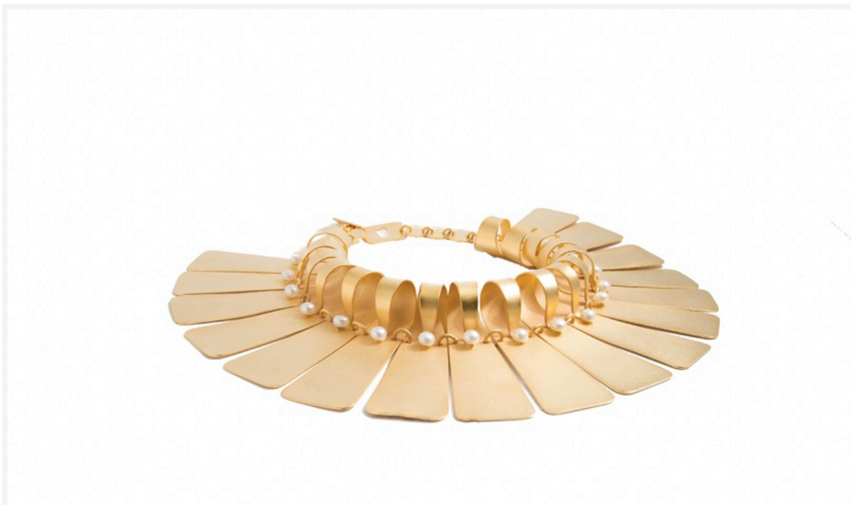
Ожерелье PIANO. Reem Jano Jewelry, Египет. Позолоченное серебро, жемчуг