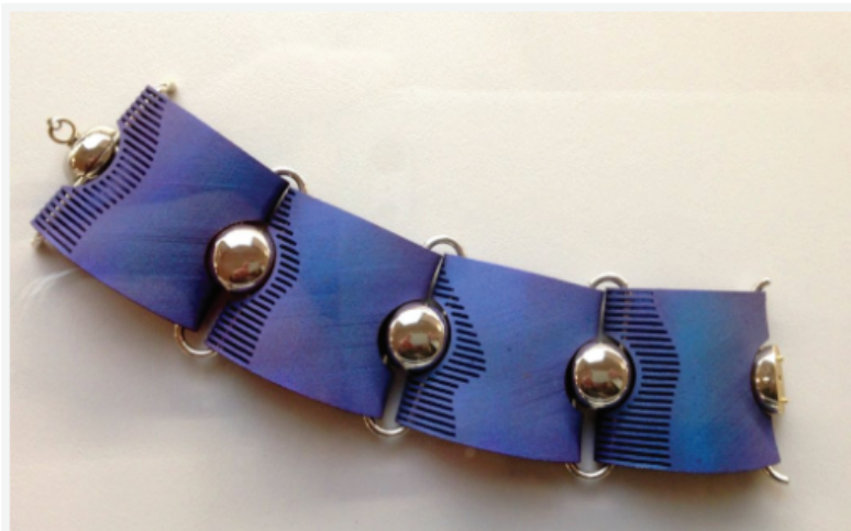
Браслет CANNOCCHIALE. GianCarlo Montebello, Италия. Дизайн 2009 г.