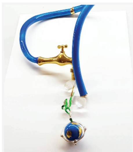
Ожерелье RUBINETTO. futuroRemoto Gioielli, Италия. Серебро, эмаль, рутиловый кварц