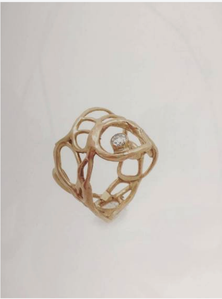
Lace Ring di Gabrielle Friedman