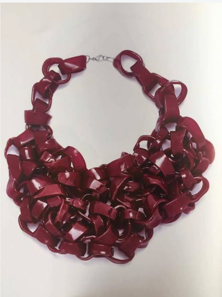
Nodes di Simona Girelli