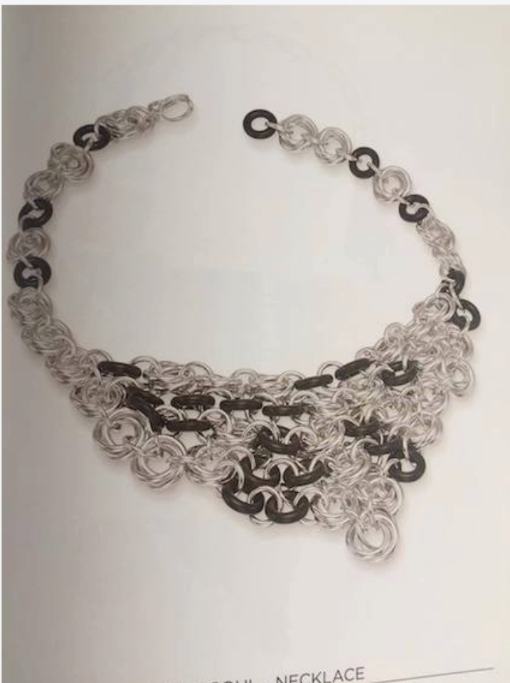
Rubber Soul NECKLACE Rubber Soul di Liisa Gude Deberitz