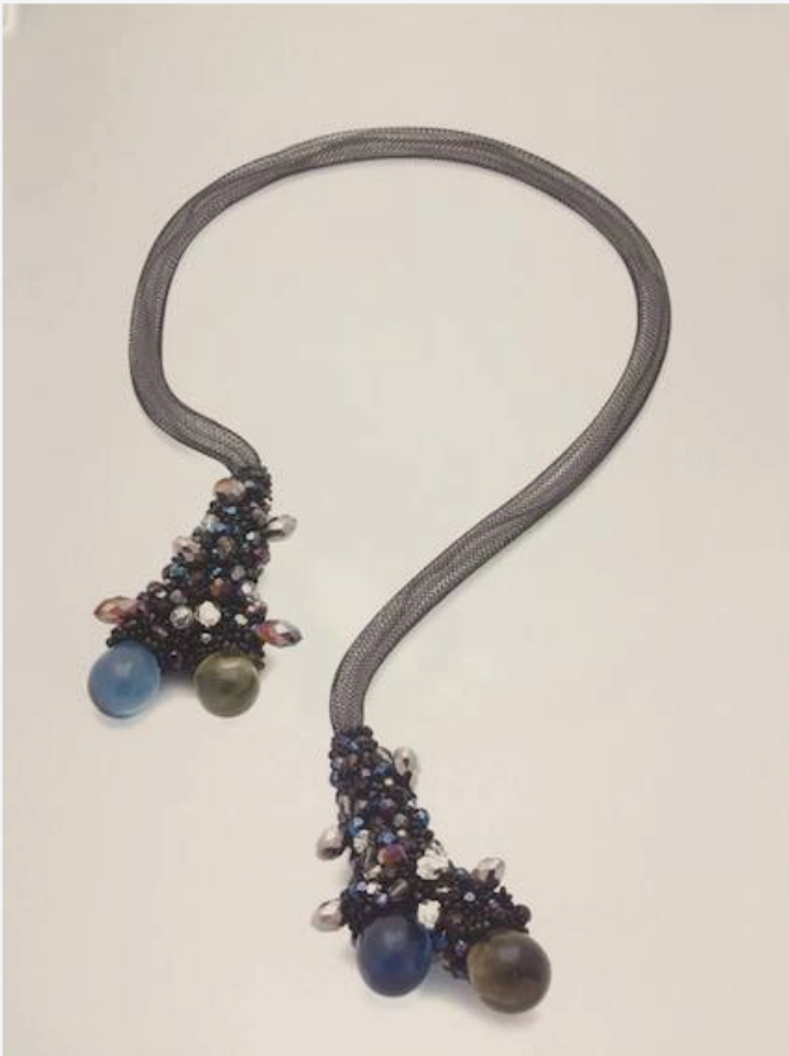
Death of the coral Reefs di Sihua Ariel Chen